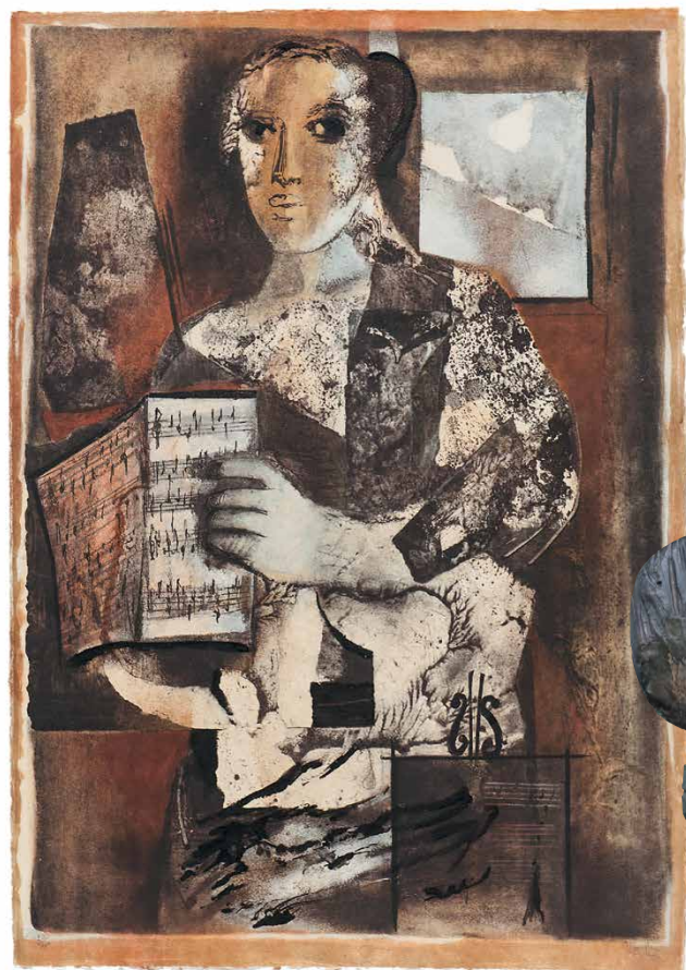
De partituur, 75 x 50 cm