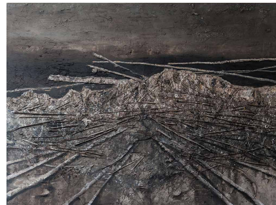
Landschap 130 x 150 cm