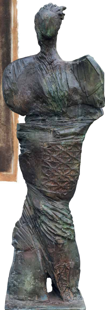
Staande figuur, brons 105 cm