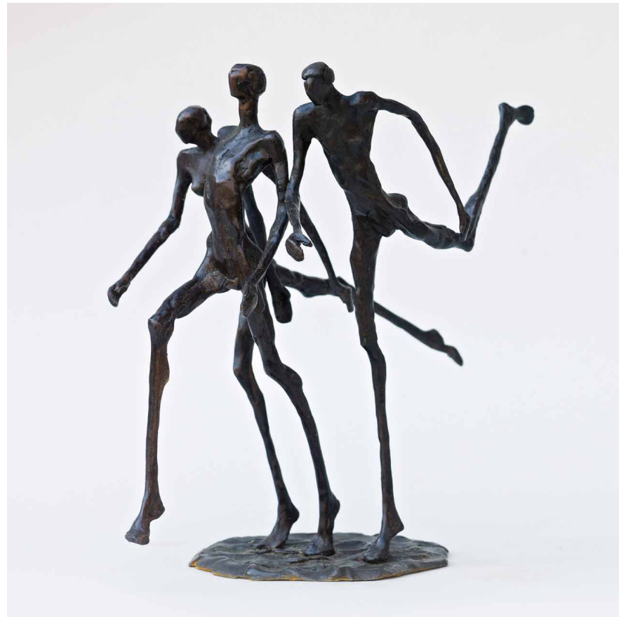
FRED BELLEFROID Lopers - Brons - 24 cm hoog