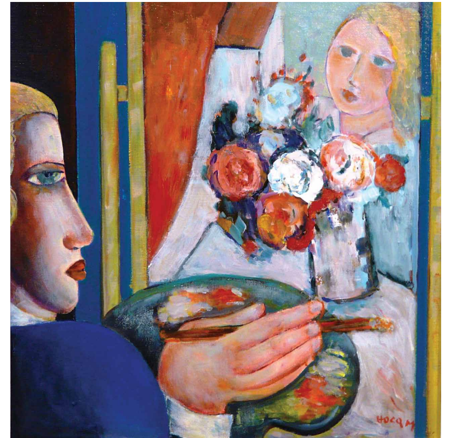
MARCEL HOCQ Le bouquet 50x50 cm - olie op doek

Zijn personages, geschilderd met krachtig palet, stralen rust uit en zijn een spiegel van pure poëzie.