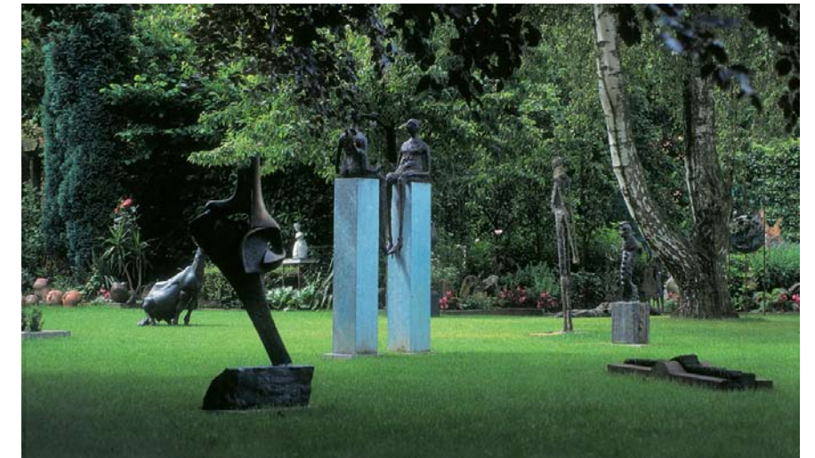
BEELDENTUIN Steeds wisselende opstelling met ongeveer 150 beelden