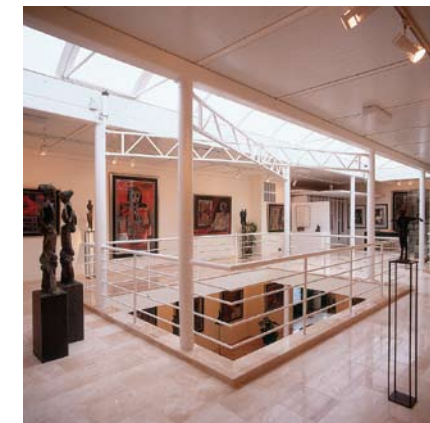
PERMANENTIE 2 verdiepingen

4de tentoonstelling november - december (eerste weekend november t.e.m. laatste weekend vóór kerstmis)