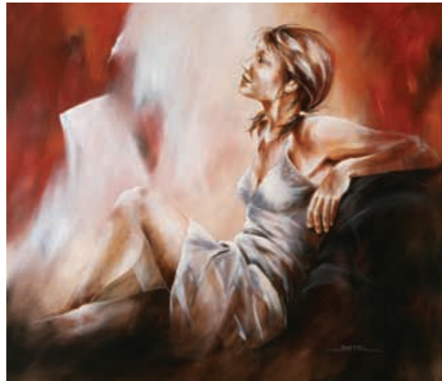
DISTEL (°1952) Bilzen (woont en werkt in Heist op den Berg )

leven als een groter geheel waarin de scherpe begrenzingen vervloeien, waar mensen zich tonen van een dierlijke kant en dieren zich verbaasde mensen weten. Een hoofs paard dat elegant naar de hemel reikt, vogels voor wie vliegen een weemoedig verhaal van vroeger is... het kan allemaal en het wordt er alleen maar échter en werkelijker op. Anders dan cynisme dat een liefdeloze onthouding is, getuigt het ook technisch bijzonder sterke werk van Demunter van een liefdevolle omhelzing van alles wat is.