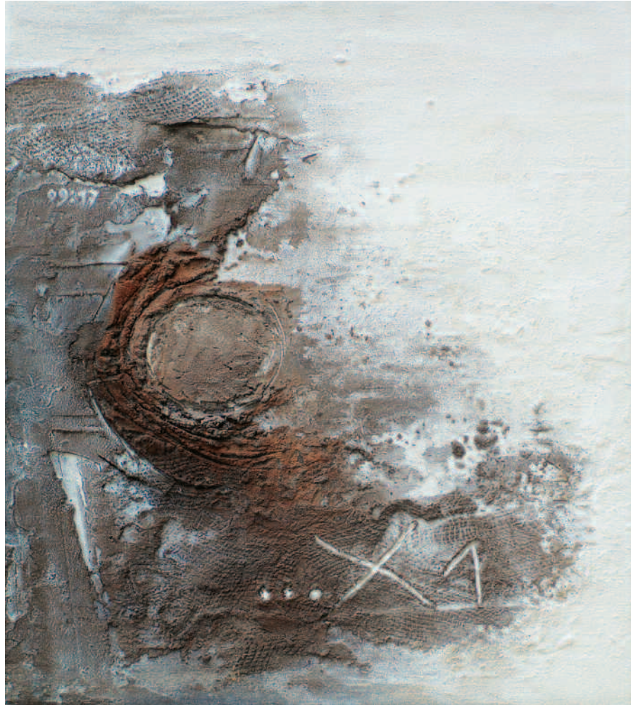
MICHEL BOCART Fraternitas, Mixed media op doek 80 x 70 cm