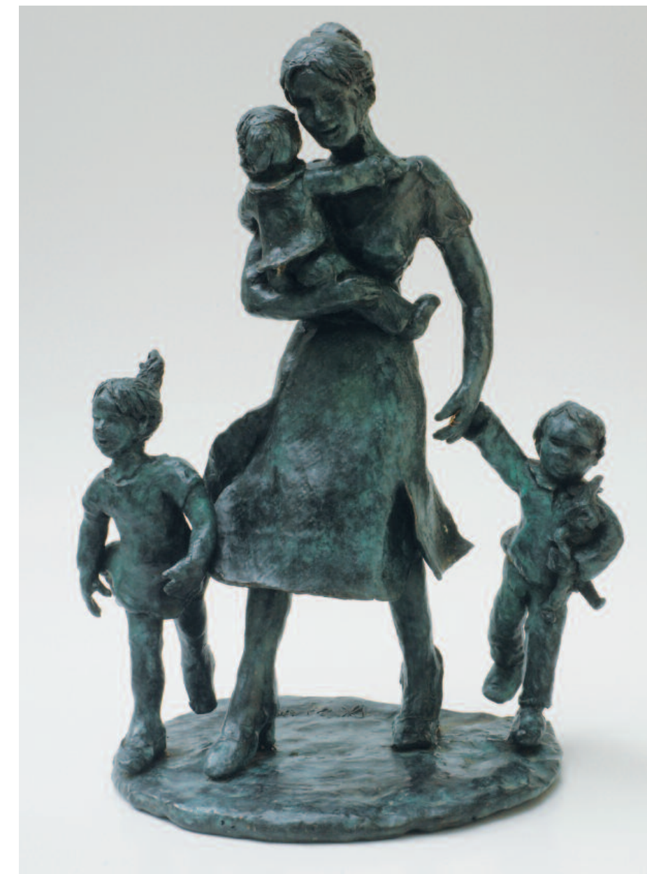
PHONSE VAN DAALEN Onder mama's bescherming, brons

Haar gevogelte bevolkt meestal kromme takken uit de levende natuur of zitten op de rand van een waterbekken. Uit haar werk spreekt een groot gevoel voor humor en detail en in het bijzonder de blijdschap van het leven.