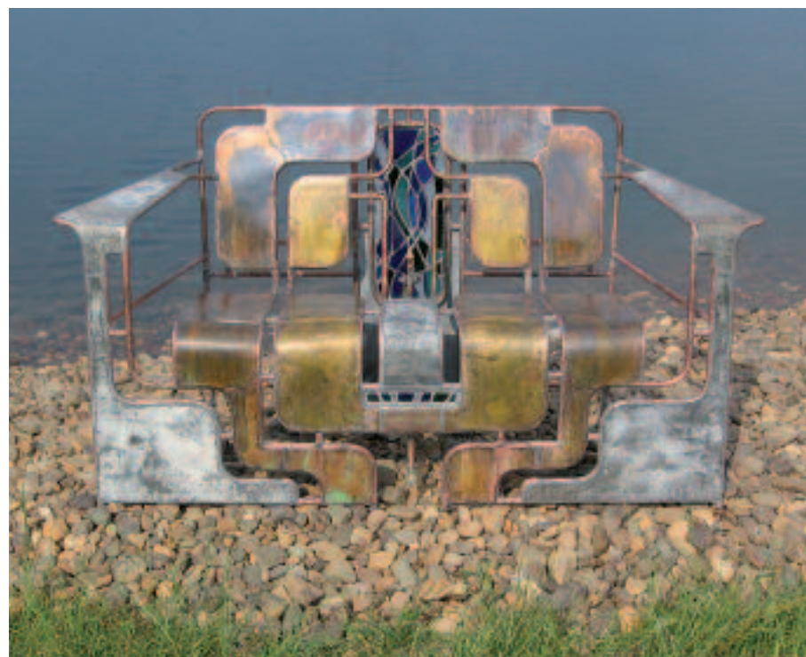
COR DE REE (°1960)

atelier ontstaan later de series schilderijen waarin hij zijn ontzag voor de oerkrachten in het landschap aan de toeschouwer overbrengt. Zijn sculpturen van voornamelijk stieren worden gekenmerkt door diezelfde oorspronkelijke oerkracht. Hun uiterlijk, verweerd, getekend door de tijd, wordt verkregen door een specifieke toepassing van terracotta en ijzeroxide, bij de bronzen sculpturen door het aanbrengen van de patine op de ruwe huid, alsof ze lange tijd in de grond verborgen waren.